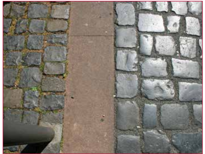
Alt und Neu | Old and new