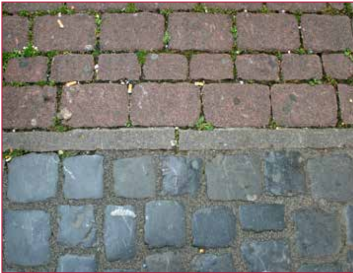
Vorher und Nacher | Before and after