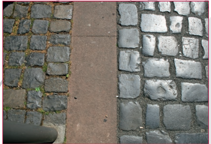
Alt und Neu | Old and new