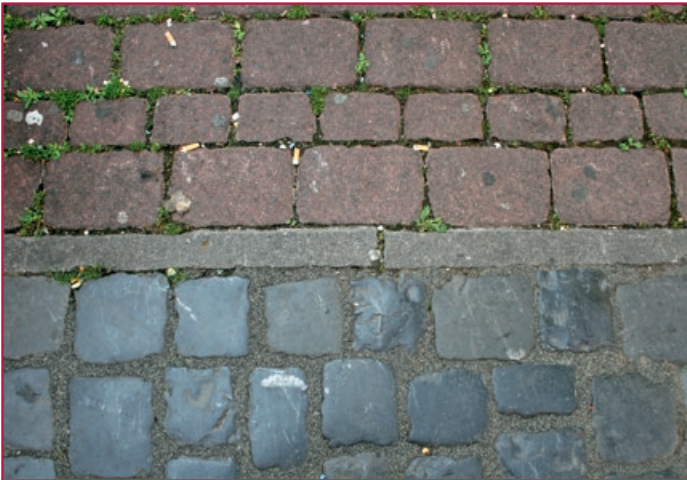
Vorher und Nacher | Before and after