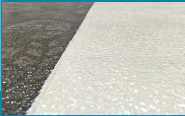
Fertige Noppe Finished stud Готовое буклированное покрытие