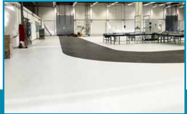
Deutlich abgesetzte Fahr- und Bearbeitungsbereiche Clearly designated driving and working areas Чётко разделённые зоны производства и проезда

Die Aufgabe: Die VOLKSWAGEN AG hat ROMEX® mit der Verlegung von ca. 5.000 m 2 Noppenbeschichtung im Kleinteilelager des Stammwerkes in Wolfsburg beauftragt. Auf zwei Ebenen wurde beschichtet. Dabei legte VW neben der chemischen und mechanischen Belastbarkeit sowie der farblichen Trennung von Fahrwegen und Produktions-/Stellflächen größten Wert auf rutschhemmende Eigenschaften unter Beibehaltung der Reinigungsfähigkeit.