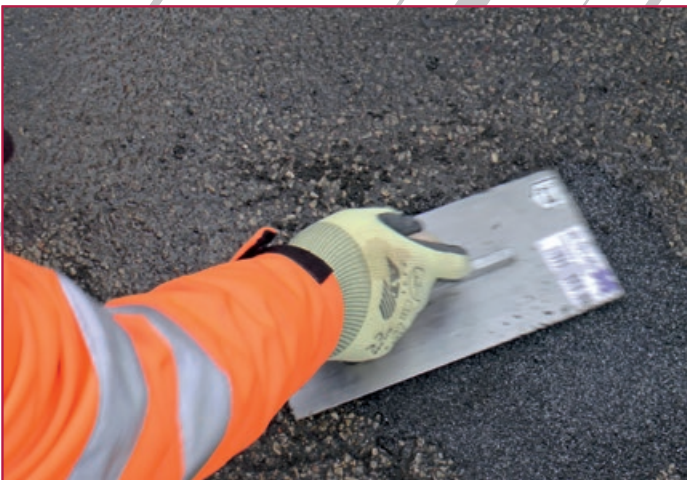
Verdichtung | Compacting