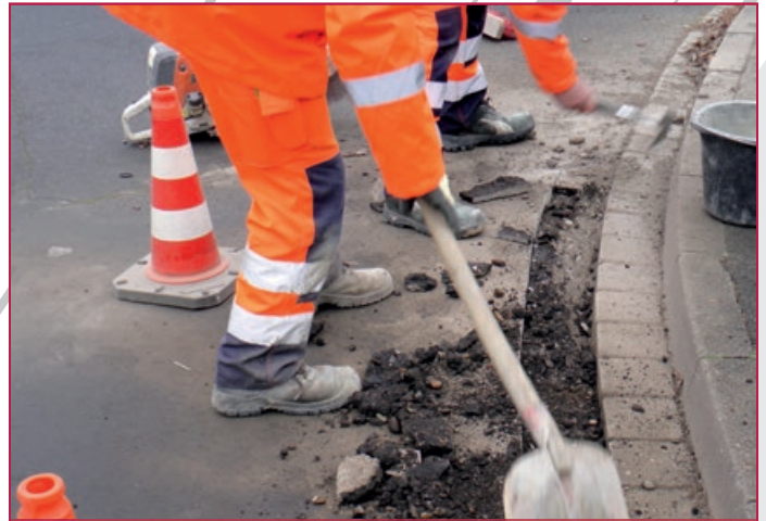
Ausgefräst und gereinigt | Ground out and cleaned