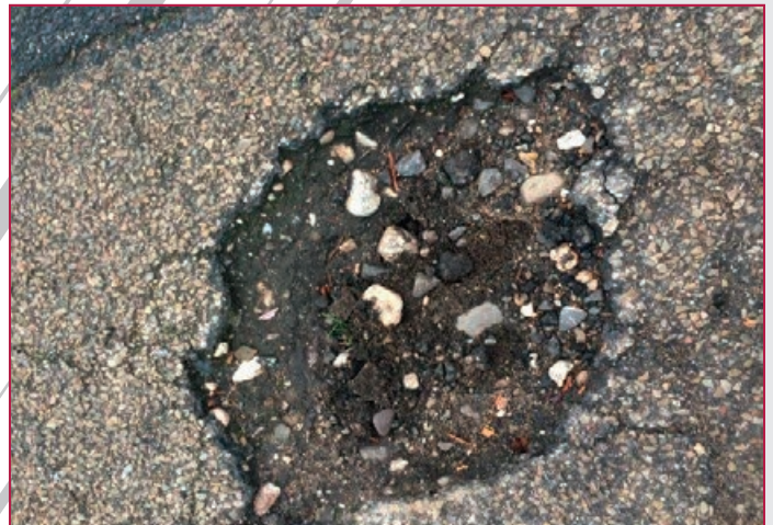
Schlagloch | Pothole