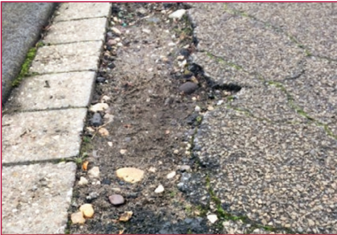
Beschädigter Asphalt | Damaged asphalt