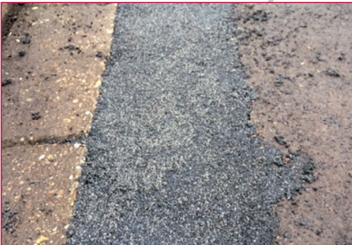
ROMPOX® - D4000 HR